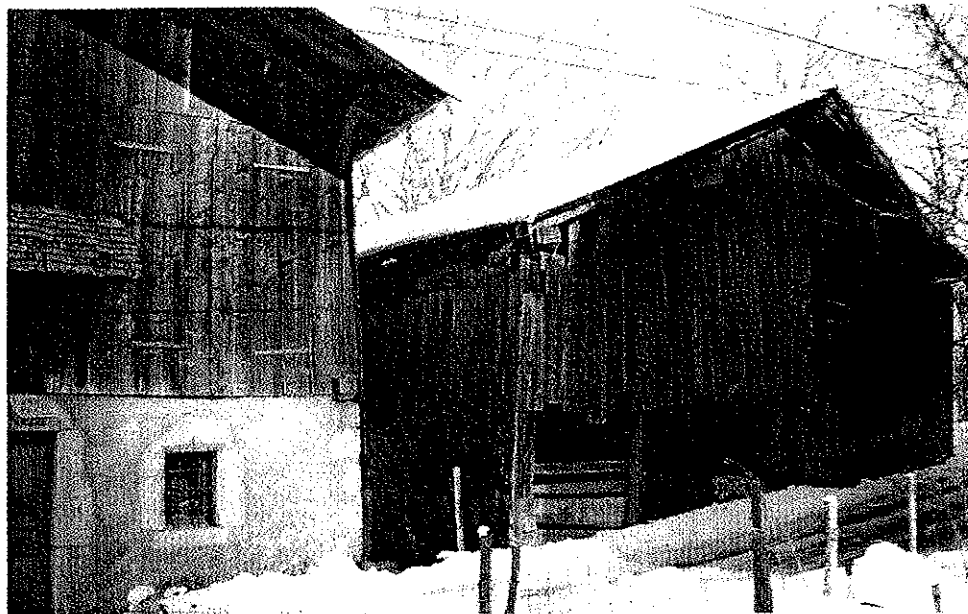
La maison du colporteur, avec à côté le grenier, dissimulé par une remise.